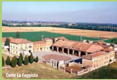
Corte La Faggiola

Storia, cultura ed enogastronomia piacentine sono in mostra a Gariga alla Faggiola , una splendida corte di inizio Novecento recentemente restaurata. Il complesso ospita un Museo dell'agricoltura e del grana padano , ed è sede di un importante ristorante didattico. Ogni domenica vi si tiene un farmers market , dove acquistare salumi, formaggi, vini e prodotti De.Co.