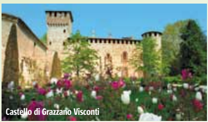
Castello di Grazzano Visconti

Il borgo neomedievale di Grazzano Visconti è sorto all'inizio del Novecento attorno al castello trecentesco . In un'atmosfera fuori dal tempo si può passeggiare tra edifici, fontane e colonne, curiosare nelle botteghe artigiane o visitare il parco di 150.000 mq che circonda il castello. Da non perdere le spettacolari rievocazioni in costume .