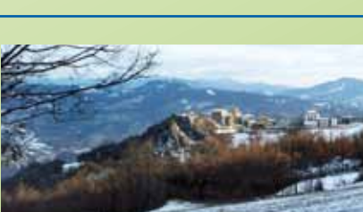
Festa della Patata

La bortellina o burtelena è un "gonfiotto" dorato e croccante preparato con farina, acqua e lievito e cotto in padella con lo strutto. Si gusta ancora bollente, da sola o accompagnata da salumi piacentini e formaggi morbidi. Bettola celebra la bortellina in una fiera molto animata , con stand gastronomici, spettacoli e carri allegorici.