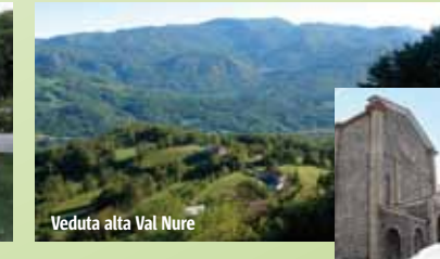
Veduta alla Val Nure

Cultura e natura: è questo il connubio che fa di località come Farini, Gropallo, Pradovera e Mareto apprezzati centri di vacanza, che offrono al visitatore varie opportunità di relax e divertimento. Concerti, storiche fiere e sagre paesane si susseguono numerose, soprattutto nella stagione estiva, in un maestoso scenario naturale.