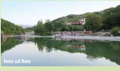
Festa sul Nure

Cultura e natura: è questo il connubio che fa di località come Farini, Gropallo, Pradovera e Mareto apprezzati centri di vacanza, che offrono al visitatore varie opportunità di relax e divertimento. Concerti, storiche fiere e sagre paesane si susseguono numerose, soprattutto nella stagione estiva, in un maestoso scenario naturale.