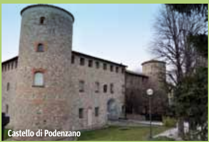
Castello di Podenzano

Maestosi castelli di pianura e palazzi nobiliari punteggiano il territorio di Podenzano e ne testimoniano il glorioso passato. Nel capoluogo c'è Castello Anguissola , risalente al XII secolo, con pianta rettangolare e quattro torri angolari. I saloni interni, con bei soffitti a cassettoni, ospitano gli uffici comunali.