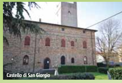
Castello di San Giorgio

L'importante e travagliato passato feudale emerge dai numerosi castelli e dalle torri che svettano in diversi punti del territorio. Il Castello di San Giorgio , oggi sede comunale, fu edificato intorno al Mille. Molto rimaneggiato nel tempo, conserva l'imponente mastio d'ingresso merlato alla guelfa, con gli incastrati del ponte levatoio. Al centro di uno dei parchi più belli del piacentino sorge la Rocca Anguissola , singolare costruzione del 1600. L'antico insediamento di Rizzolo con castello e pieve romanica ha dato i natali al pittore di fama internazionale Francesco Ghisloni (1855-1928).