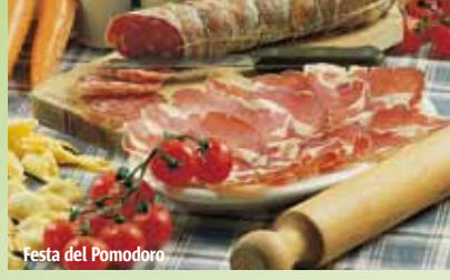
Festa del Pomodoro

Storia, cultura ed enogastronomia piacentine sono in mostra a Gariga alla Faggiola , una splendida corte di inizio Novecento recentemente restaurata. Il complesso ospita un Museo dell'agricoltura e del grana padano , ed è sede di un importante ristorante didattico. Ogni domenica vi si tiene un farmers market , dove acquistare salumi, formaggi, vini e prodotti De.Co.