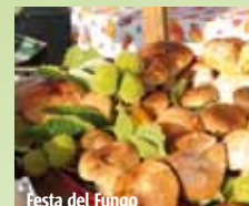
Festa del Fungo

Passeggiare o percorrere in auto la valle del Riglio permette di scoprire suggestivi paesaggi, con prati verdeggianti e lievi pendii punteggiati da vigneti. Qua e là fanno capolino dimore patrizie e antichi fortificati. Ricchi di fascino i boschi presso Ronco e Tollara, che regalano funghi pregiati, grandi protagonisti della cucina locale.