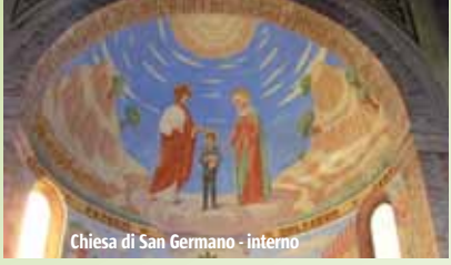
Chiesa di San Germano - interno

Nella piccola frazione di Maiano, località di origine romana al confine con Grazzano Visconti, merita una sosta la piccola chiesa di SS. Ippolito e Cassiano , originaria dell'XI secolo e restaurata nel 1949. All'interno custodisce un affresco del XV secolo.