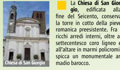
Chiesa di San Giorgio

L'importante e travagliato passato feudale emerge dai numerosi castelli e dalle torri che svettano in diversi punti del territorio. Il Castello di San Giorgio , oggi sede comunale, fu edificato intorno al Mille. Molto rimaneggiato nel tempo, conserva l'imponente mastio d'ingresso merlato alla guelfa, con gli incastrati del ponte levatoio. Al centro di uno dei parchi più belli del piacentino sorge la Rocca Anguissola , singolare costruzione del 1600. L'antico insediamento di Rizzolo con castello e pieve romanica ha dato i natali al pittore di fama internazionale Francesco Ghisloni (1855-1928).