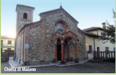
Chiesa di Maiano

Maestosi castelli di pianura e palazzi nobiliari punteggiano il territorio di Podenzano e ne testimoniano il glorioso passato. Nel capoluogo c'è Castello Anguissola , risalente al XII secolo, con pianta rettangolare e quattro torri angolari. I saloni interni, con bei soffitti a cassettoni, ospitano gli uffici comunali.