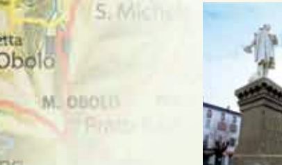
Statua di Colombo

Dedicata al grande navigatore originario di Pradello (Bettola), Piazza Colombo è proprio nel cuore del paese. Qui si affacciano gli edifici più importanti e si svolge l'animato mercato settimanale, eredità della vocazione commerciale che Bettola ha avuto fin dal Medioevo grazie alla strategica posizione lungo la Via dell'olio.