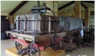
Museo del Vino

Il borgo neomedievale di Grazzano Visconti è sorto all'inizio del Novecento attorno al castello trecentesco . In un'atmosfera fuori dal tempo si può passeggiare tra edifici, fontane e colonne, curiosare nelle botteghe artigiane o visitare il parco di 150.000 mq che circonda il castello. Da non perdere le spettacolari rievocazioni in costume .