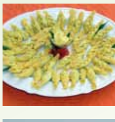
Tortello con la coda De.Co.

Piccole valli alberate e dolci colline coperte di vigneti invitano a facili passeggiate, e a piacevoli soste nelle numerosissime cantine , spesso ospitate in pregevoli edifici storici. Come Villa Peyrano , antico convento gesuita circondato da un magnifico giardino all'italiana o Villa Barattieri con la facciata monumentale preceduta da alberi secolari.