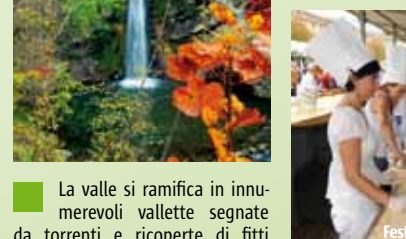
Festa della Bortellina

L'alta Val Nure è un paradiso per gli amanti della natura e delle attività all'aperto. Attraverso i numerosi percorsi di trekking, mountain bike o lungo l'ippovia si può godere di una natura ancora incontaminata.