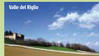
Valle del Riglio

L'antica frazione di San Damiano è celebre per le apparizioni della Madonna delle Rose , che si sarebbe manifestata più volte, a partire dal 1964, a una modesta contadina. Sul luogo delle apparizioni mariane il "Piccolo giardino di Paradiso" e il Pozzo sono meta incessante di pellegrinaggio.