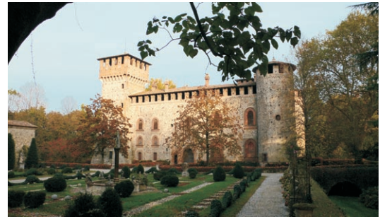
Il castello di Grazzano Visconti

La passeggiata lungo l'antica via dei mulini e l'argine del torrente permette di passare accanto anche a due manufatti di interesse storico: la vecchia chiesa, databile tra la fine del XIII e l'inizio del XIV secolo e non più adibita al culto dal 1966, e Sant'Angelo al Nure, che con ogni probabilità è la chiesa più antica di Vigolzone dedicata a San Michele e sorta tra il VII e l'VIII secolo forse ad opera dei Longobardi, particolarmente devoti a questo santo.